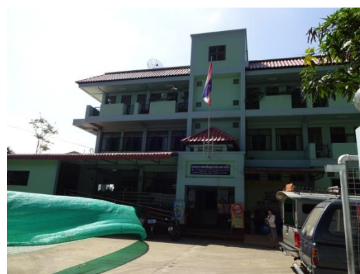
図2 チェンマイ市の群病院動場所

タイでは、日本の養護教諭の相当する活動は、CHN が行っています。呼び名は、school nurse として呼ばれ、学校に 1 人配属されていました。活動内容は、授業での性教育や、保健室での健康相談を行っていました。活動の例として、高校生が妊娠をした場合には、思春期クリニックの受診を勧めるなどを行っていました。生徒からの性に関する問題や相談