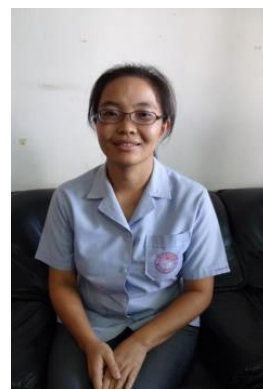
図3 群病院で活動するCHN