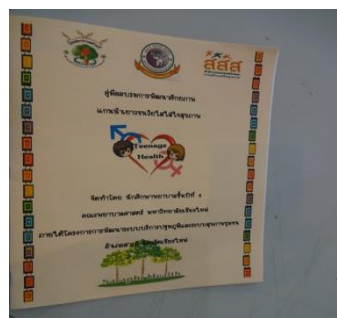
図4 チェンマイ大学看護学部と連携で作成された性教育のパンフレット